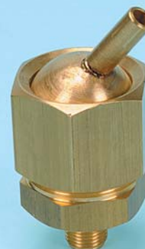
F3S 1/8" M. - INCL. 45°