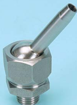
F3S 1/4" M. - INCL. 45°