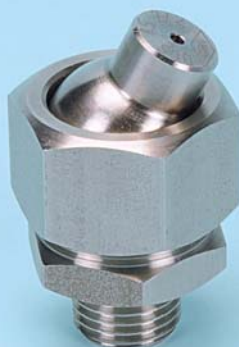
F3S 3/8" M. - INCL. 30°